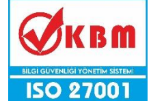
Renk Kodu: #01A0E2 (Mavi) Renk Kodu: #ff0000 (Kırmızı) Yükseklik/Genişlik = 0,759