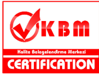
Renk Kodu: #ff0000 (Kırmızı Genel) Yükseklik/Genişlik = 0,759

2.23 KBM logo için aşağıda belirtilen oranlar ve renkler sabit kalmak şartıyla boyutlar büyütülüp, küçültülebilir.