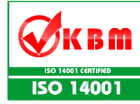
Renk Kodu: #009933 (Yeşil Genel) Renk Kodu: #ff0000 (Kırmızı) Yükseklik/Genişlik = 0,759